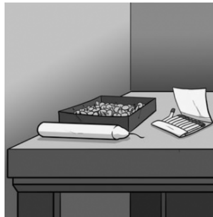
The candle problem presented.