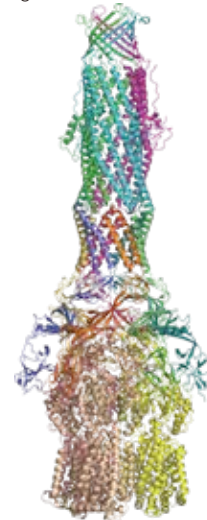
図2:緑膿菌由来異物排出蛋白質複合体 MexAB-OprMの構造 (Tsutsumi et al., Nat. Commun., 2019)