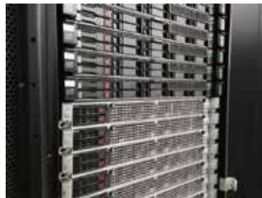
図1. ハイパフォーマンス計算機システム

ヒトの初期胚は、4細胞期に起こるゲノム活性化を通して転写が開始し、新たな蛋白質を作って細胞の分化を進めていきます。最近の研究で、DUX4という転写因子がゲノム活性化の最初期に発現し、様々な遺伝子やレトロトランスポゾンの発現を誘導することが明らかになってきました。我々は、1細胞レベルのトランスクリプトームデータとATAC-Seq、ChIP-Seqのデータを組み合わせ、初期胚でレトロトランスポゾンが活性化するメカニズムの解明に取り組んでいます。また、旧世界ザルや新世界ザルとヒトの初期発生を比較し、霊長類の間で保存している機構とヒトにしか存在しない特徴を明らかにしたいと考えています。更に、一部のレトロトランスポゾンは初期胚とともに体細胞においても発現していることがわかってきており、レトロトランスポゾンが生殖系列で挿入され、生殖系列以外で活性化するメカニズムとその意義について研究を進めています。